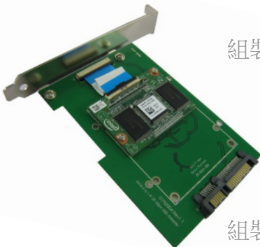
組裝 Intel ZIF 固態硬碟