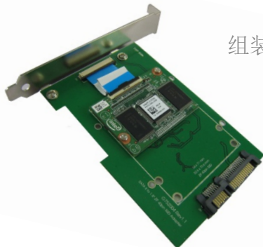
组装 Intel ZIF 固态硬盘

CB946FB 是 SATA to 1.8" ZIF SSD & HDD 转接卡,提供一组标准 7+15pin SATA 链接器对主机的连接,及一组 ZIF 40pin 0.5mm pitch 链接器对储存装置的连接。当完成组装,可正常运作于各种操作系统。例如 DOS, Windows 95, 98, XP, 2000, Vista, Win 7, Linux, Unix 等。CB946FB 转接卡 允许 备安装的 1.8" ZIF 储存装置当成系统磁盘, 直接启动操作系统, 不需安装任何驱动程序, 而且不会影响 SSD 储存装置 的执行速度。