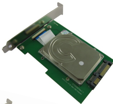
组装 1.8" ZIF 硬盘