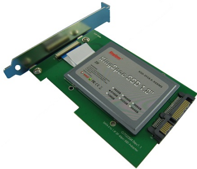
组装 1.8" ZIF 固态硬盘