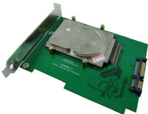
組裝 1.8" IDE 硬碟 (高:8.0mm)