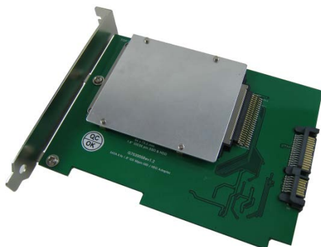
組裝 1.8" IDE 硬碟 (高:5.0mm)