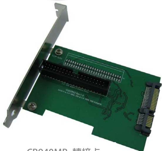
CB940MB 轉接卡 正面