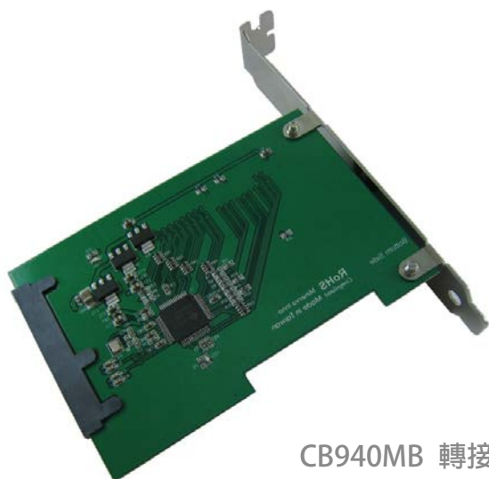
CB940MB 轉接卡 背面