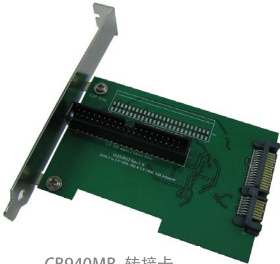
CB940MB 转接卡 正面

CB940MB/C 是 SATA to 3.5" 40pin HDD 转接卡,提供一组标准 7+15pin SATA 链接器对主机的连接, 及一组完成组装, 可正常运作于各种操作系统。例如 DOS, Windows 95, 98, XP, 2000, Vista, Win 7, Linux, Unix 等。CB940MB/C 转接卡允许安装的 3.5" IDE 储存装置当成系统磁盘, 直接启动操作系统, 不需安装任何驱动程序, 而且不会影响储存装置的执行速度。