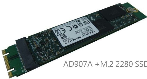
AD907A + M.2 2280 SSD

AD907A 模組是 M.2(NGFF) 對 M.2(NGFF) 轉接卡。它提供 M.2 dual key B+M 雙凹槽金手指, 及一組 M.2 67pin B key 連結器。配合 AD904A 轉接卡使用, 可當作 M.2 SSD 儲存裝置的測試載板製具。由於頻繁的插拔測試 M.2 SSD, 容易造成主機上的 M.2 連結器故障, 致使主機維修困難。透過測試載板製具使用, 一旦連結器故障, 可立刻更換 AD907A 載板製具, 而不影響測試工作的進行。