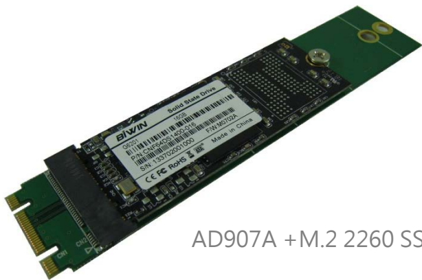
AD907A + M.2 2260 SSD