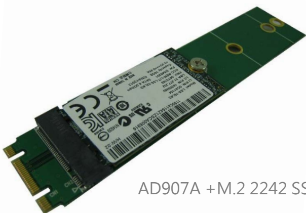
AD907A +M.2 2242 SSD