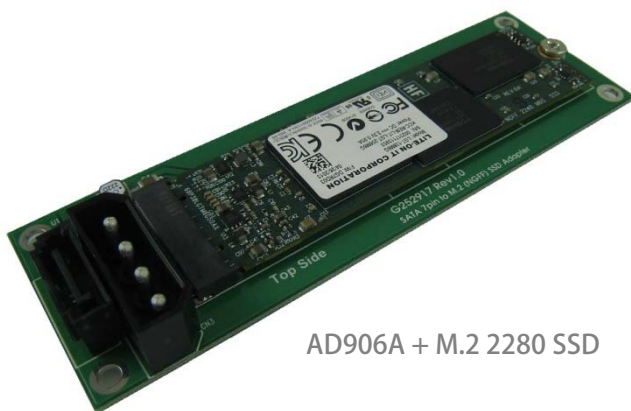
AD906A + M.2 2280 SSD