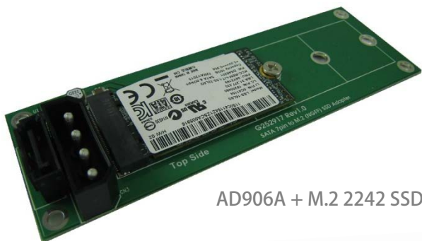
AD906A + M.2 2242 SSD

AD906A 提供 M.2(NGFF) Series SSD 对 SATA III 界面的转接卡。内含一组 7pin SATA 链接器对主机 SATA port 的连接，一组 4pin 电源链接器，及一组 67pin B key 链接器对 M.2 SSD 储存装置的连接。当组装完成，可适用于各种操作系统。例如 DOS, Windows 95, 98, XP, 2000, Vista, Win 7, Win 8, Linux, Unix 等。AD906A 转接卡允许被安装的 M.2 SSD 当成系统磁盘，直接启动操作系统，不需安装任何驱动程序，而且不会影响 SSD 储存装置的执行速度。