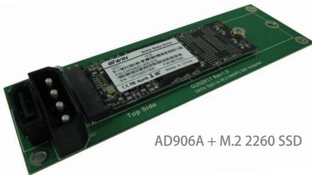
AD906A + M.2 2260 SSD