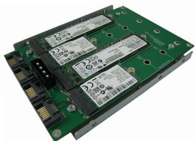
AD904E 转接卡+ M.2 SSD