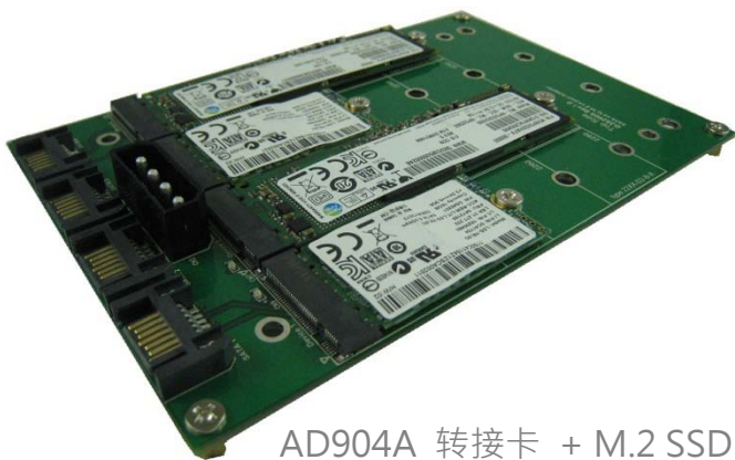
AD904A 转接卡 + M.2 SSD

AD904A/AD904E 提供 M2(NGFF) Series SSD 对 SATA III 接口的转接卡。内含 4 组 7pin SATA 链接器对主机的连接，4 组 67pin B key 链接器对 M.2 SSD 储存装置的连接。当组装完成，可适用于各种操作系统。例如 DOS, Windows 95, 98, XP, 2000, Vista, Win 7, Win 8, Linux, Unix 等。AD904A/AD904E 转接卡允许被安装的任 1 port M.2 SSD 当成系统磁盘，直接启动操作系统，不需安装任何驱动程序，而且不会影响 SSD 储存装置的执行速度。