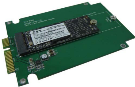
AD902A + M.2 (2260) SSD