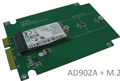
AD902A + M.2 (2242) SSD

AD902A 提供 M2(NGFF) Series SSD 對 SATA III 介面的轉接卡。內含一組 7+15pin SATA Edge-Finger 對主機的連接。一組 67pin B key 連結器對 M.2 SSD 儲存裝置的連接。當組裝完成，可適用於各種作業系統。例如 DOS, Windows 95, 98, XP, 2000, Vista, Win 7, Win 8, Linux, Unix 等。AD902A 轉接卡允許被安裝的 M.2 SSD 當成系統磁碟，直接啟動作業系統，不需安裝任何驅動程式，而且不會影響 SSD 儲存裝置的執行速度。