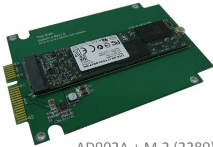
AD902A + M.2 (2280) SSD