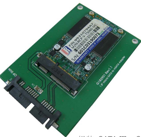
组装 SATA III mSATA SSD