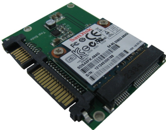
组装 SATA III mSATA SSD

AD563FA9 提供 mSATA SSD 对 SATA III 接口的转接卡，内含一组标准 7+15pin SATA 链接器对主机的连接，一组 52pin Mini PCI-e 链接器对 mSATA SSD 储存装置的连接。当组装完成，可适用于各种操作系统。例如 DOS, Windows 95, 98, XP, 2000, Vista, Win 7, Linux, Unix 等。AD563FA9 转接卡允许被安装的 mSATA SSD 当成系统磁盘，直接启动操作系统，不需安装任何驱动程序，而且不会影响 mSATA SSD 储存装置的执行速度。