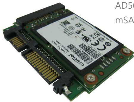
AD563FA5+Full Size mSATA SSD