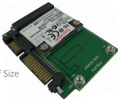
AD563FA5+Half Size mSATA SSD