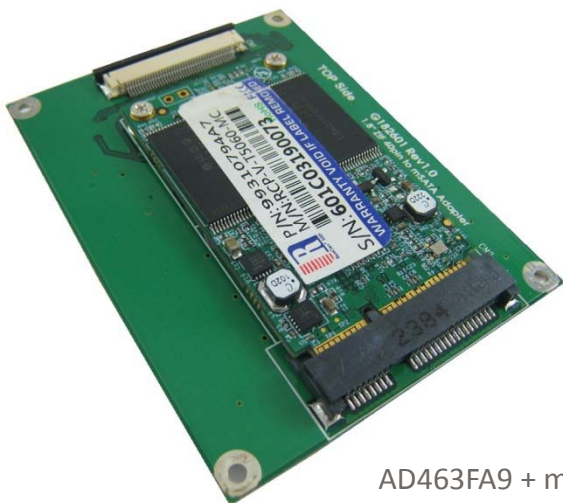
AD463FA9 + mSATA

AD463FA9 是一款 mSATA SSD 對 ZIF 40pin 轉接卡。它內建 Mini PCI-e 52pin connector，可安裝 mSATA SSD。當組裝完成後，就是一款 1.8" ZIF SSD，可正常運作於各種作業系統。例如 DOS, Windows 95, 98, XP, 2000, Vista, Win 7, Linux, Unix 等。AD463FA9 轉接卡允許安裝的 mSATA SSD 當成系統磁碟，直接啟動作業系統，不需安裝任何驅動程式。