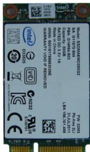
Intel mSATA SSD

AD263FB9/E9 是一款经济型的 3.5" 固态硬盘。它可使用 3.5" 外框或是 PCI-e Bracket, 加上 mSATA SSD 卡对 IDE 转接卡的结合。当组装完成后, 可正常运作于各种操作系统。例如 DOS, Windows 95, 98, XP, 2000, Vista, Win 7, Linux, Unix 等。AD263FB9/E9 转接卡允许安装的 mSATA SSD 当成系统磁盘, 直接启动操作系统, 不需安装任何驱动程序, 而且不会影响 SSD 储存装置的执行速度。