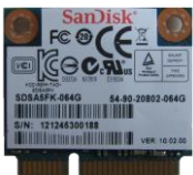
Sandisk mSATA SSD