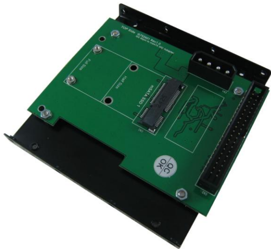
AD263FE9 转接卡 + 3.5" 支架